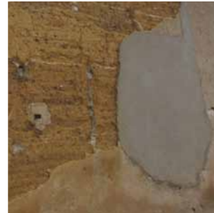
Incompatibilité entre les matériaux (ici pisé et ciment) Accroche fragilisée Chute de l'enduit par plaques