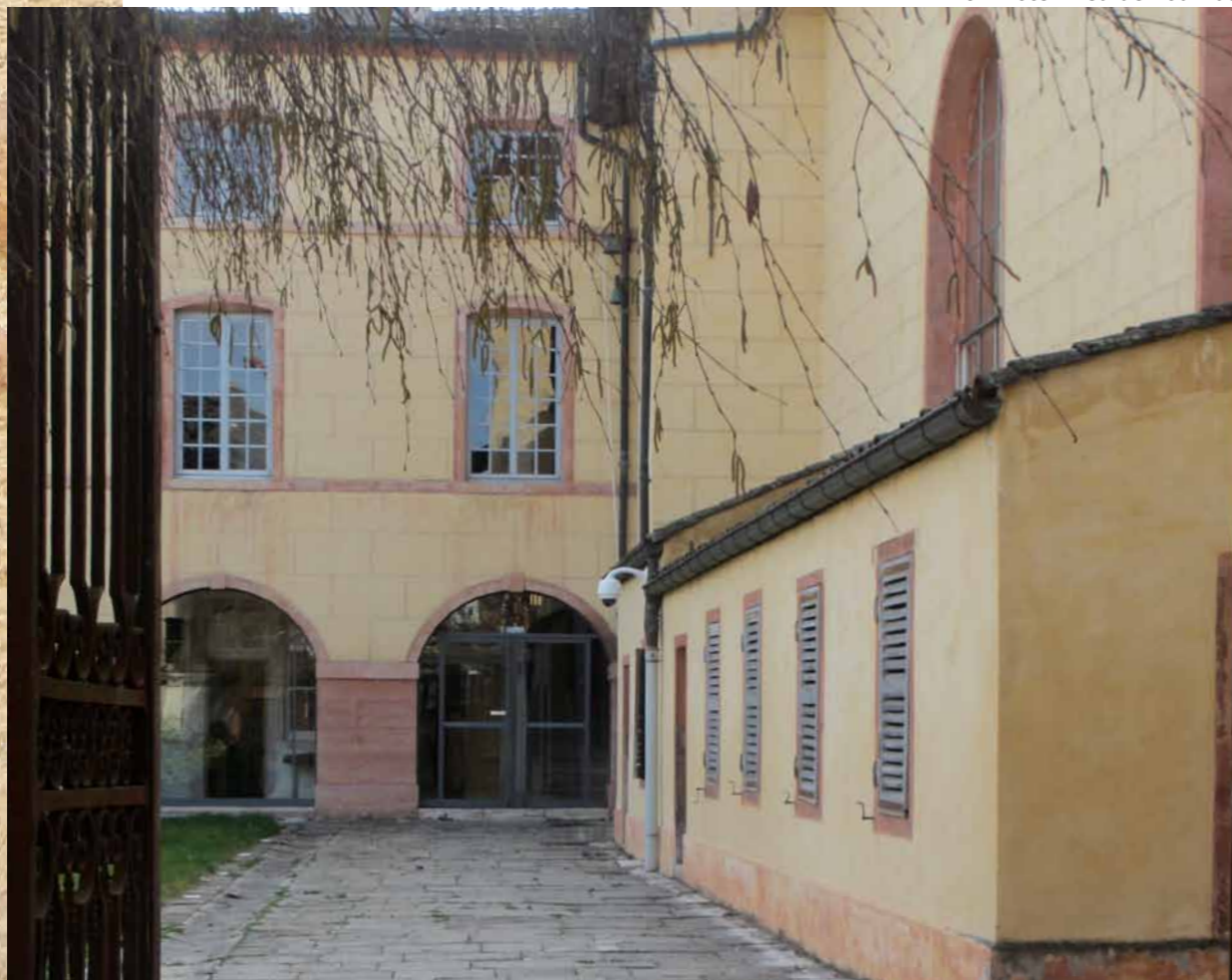
Les couleurs d'enduit et de badigeon mettent en valeur les éléments architecturaux des bâtiments Ici l'Hôtel Dieu de Tournus