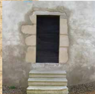
Humidité visible en pied de mur

Le vieillissement constitue également une cause de désordre des enduits à la chaux qui s'effritent, se fissurent, se décollent ou laissent apparaître des taches. Une mauvaise mise en œuvre des enduits peut également être source de désordres apparents : conditions climatiques défavorables, mauvaise préparation du support, dosage mal calculé, incompatibilité entre certains matériaux entrant dans la composition du mélange.