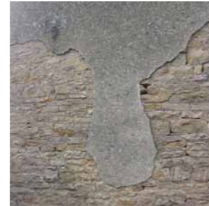
Ancien enduit se délitant