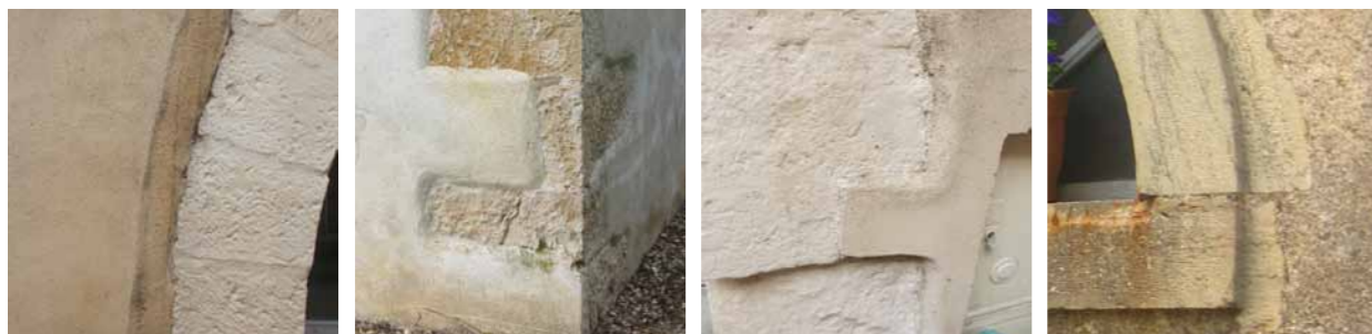
Enduit en surépaisseur, chanfrein, enduit en "sous-épaisseur" : problèmes de mise en œuvre ?

Éviter également les "sous-épaisseurs" : il est important de respecter les différentes parties taillées de la pierre. Ainsi la partie bouchardée est destinée à servir d'accroche pour l'enduit qui doit être lissé au nu de la partie lisse de la pierre d'ouverture.